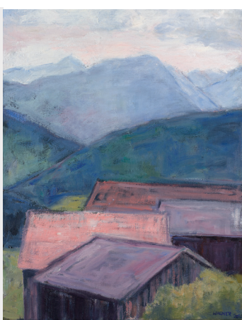
In Schwarzenberg, Öl auf Leinwand 2018, 70 x 50 cm

Öffnungszeiten während der Schubertiade: Täglich 9.00 – 12.00 und 15.00 – 19.00 Uhr Vernissage: 21. Juni 2019 Veranstalter: Reiner Wagner Information: www.annarubin.at