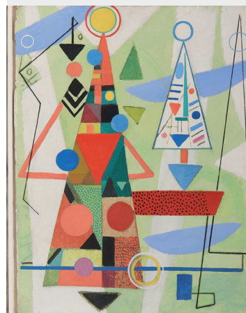
Max Ackermann, Über allen Türmen, Öl und Tempera auf Malkarton, 1948