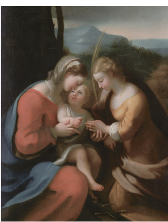
Kat. 26 Angelika Kauffmann, nach Correggio: Die mystische Verlobung der hl. Katharina, 1763/64, Privatsammlung Voralberg

Öffnungszeiten: Täglich 10.00 – 12.00 und 15.00 – 19.00 Uhr Eröffnung: Freitag, 21. Juni, 18.00 Uhr Information: Ulrike Maria Kleber Tel. +43 (0)664 936 61 07 www.ulrikemariakleber.at Thomas Bohle www.thomasbohle.com